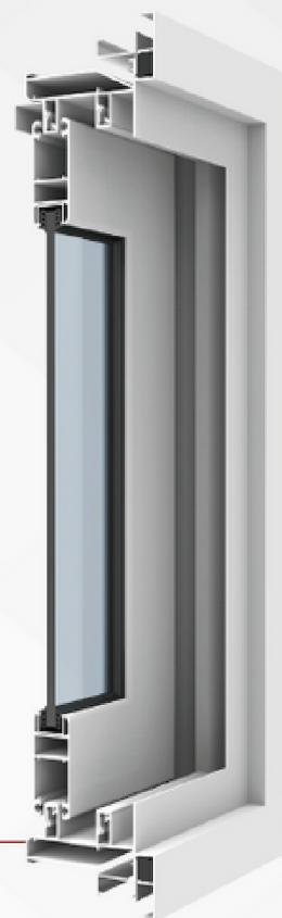
Vista Interna Corte Vertical